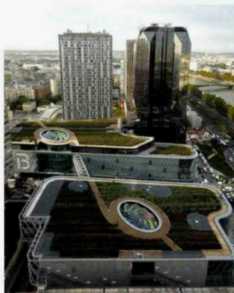
Beaugrenelle, le nouveau centre commercial du 15 ème arrondissement à Paris, sur les bords de Seine, architecture Valode et Pistre.