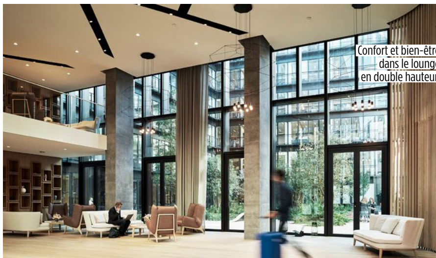
Confort et bien-être dans le lounge en double hauteur.

Place Saint-Augustin, à deux pas de la gare Saint-Lazare, exit le Cercle national des armées, qui occupait l'ancienne caserne royale de la Pépinière, datant du XVIII e siècle. Après un an et demi de travaux, le nouveau siège de Gide regroupe désormais 600 collaborateurs du fameux cabinet d'avocats d'affaires au sein d'un bâtiment trois-en-un conçu par l'agence PCA Stream. Côté rue, l'aile historique a recouvré son lustre d'antan. Côté cour, l'immeuble de bureaux largement vitré affiche ses huisseries inspirées des verrières artisanales parisiennes. Entre les deux ? Un pavillon monumental dévolu aux échanges et aux réceptions. « Horizontalité et transparence sont les maîtres mots de cet ensemble tertiaire de 19 000 mètres carrés », souligne son architecte, Philippe Chiambaretta. Qui privilégie le confort et le bien-être : lounge en double hauteur, jardin central organisé comme une place de village, conciergerie et salle de sport ouvertes vingt-quatre heures sur vingt-quatre. Cette métamorphose distille aussi une certaine hauteur de vue ! De nombreux balcons et un toit-terrasse végétalisé offrent un panorama grandiose sur l'église Saint-Augustin, Montmartre et les toits de la capitale ■ BRUNO MONIER-VINARD