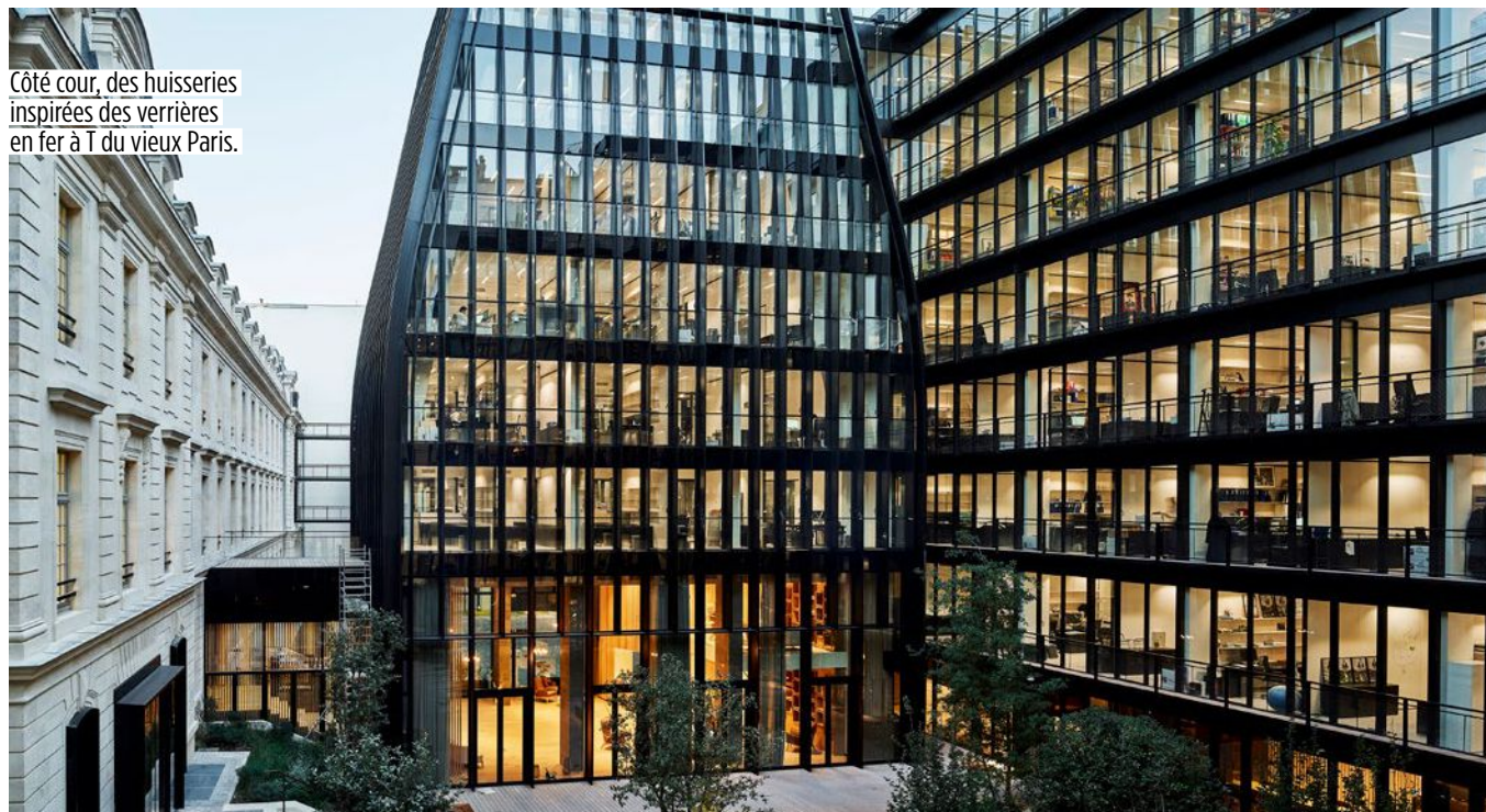
Côté cour, des huisseries inspirées des verrières en fer à T du vieux Paris.