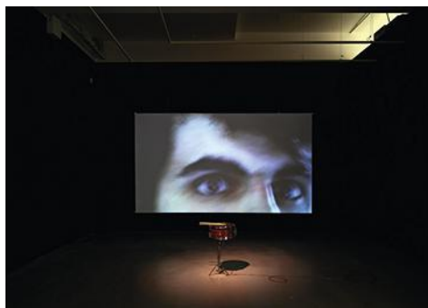
Hôtel des collections La première exposition du site, pivot du MoCo, est consacrée aux trésors du Japonais Ishikawa. Avec des œuvres de Danh Vo ( ci-dessus ) et d'Anri Sala ( à gauche ).