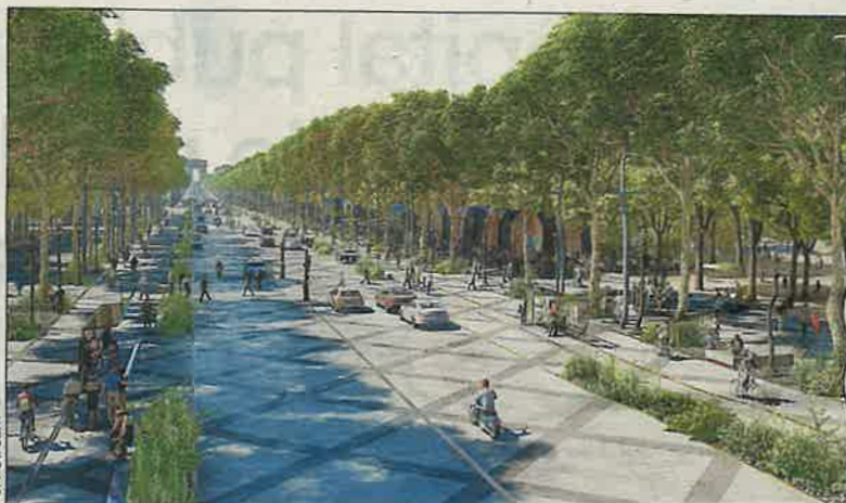
Une vue du projet, qui se revendique d'une architecture zéro carbone.

C'est pour répondre à ce paradoxe et «trouver des remèdes à cette condition de ville malade» que Philippe Chiambaretta s'est entouré d'une «cinquantaine d'experts, d'entreprises,