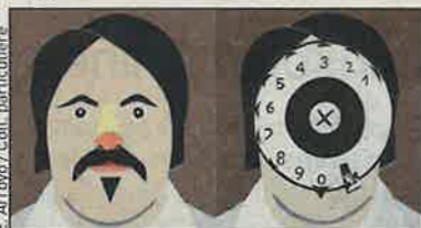
E. Arroyo / Coll. particulière

De 6 à 8 €, gratuit pour les moins de 18 ans et sous conditions. 47, rue Raynouard. Métro Passy ou La Muette.