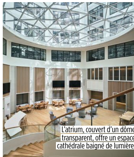
L'atrium, couvert d'un dôme transparent, offre un espace cathédrale baigné de lumière.