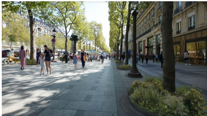
Les pieds d'arbres des Champs-Élysées après la rénovation.