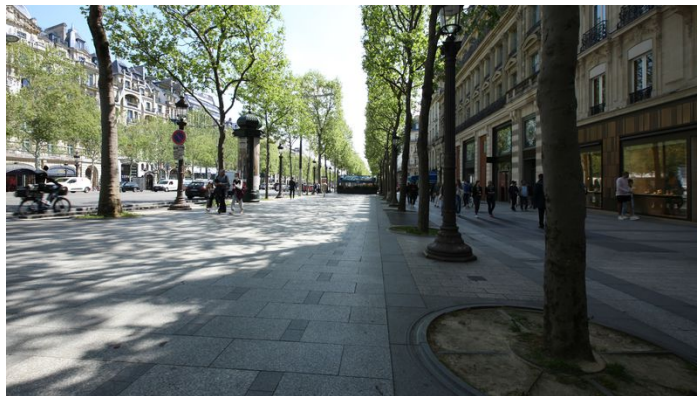
Les pieds d'arbres des Champs-Élysées avant la rénovation.

Anne Hidalgo indique que la Ville procédera aux rénovations des "pieds d'arbres qui seront végétalisés. L'ensemble du mobilier urbain sera également restauré. La piétonisation le dimanche sera étendue aux jardins". Elle indique également que les jardins seront rénovés "d'ici 2024" avec "plus de 15 000 m 2 de nouvelles plantations, 7 000 m 2 de routes transformées en allées de jardins et plus de 100 nouveaux arbres".