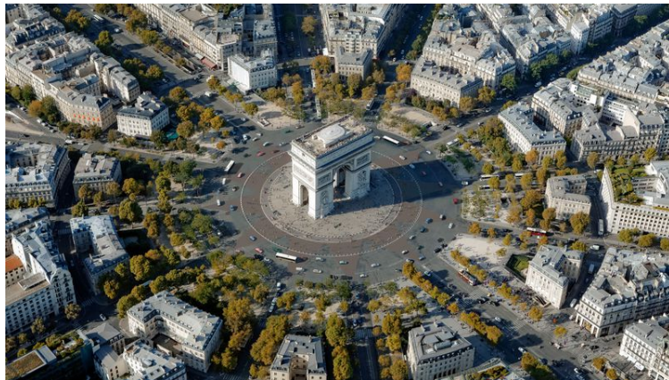
Photo aérienne de la place de l'Etoile après le lancement du projet. Le but est d'élargir le cercle de la place.

"Tenir compte du changement climatique et du défi du siècle, ça veut dire agir sur deux leviers : planter des arbres et réduire le trafic automobile qui est la cause de la pollution automobile, et donc de (...) la première cause de mortalité », expliquait ce mercredi Anne Hidalgo lors de la conférence de presse.