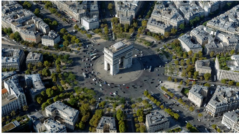
Photo aérienne de la place de l'Etoile avant le lancement du projet.