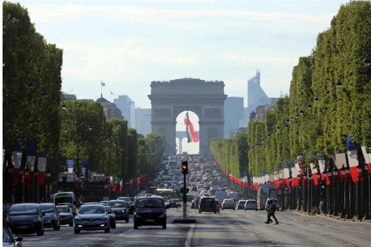
La mairie de Paris a dévoilé ce mercredi son projet de transformation de l'avenue des Champs-Élysées. ● © LUDOVIC MARIN / AFP

Le principal objectif de la mairie de Paris est de redonner envie aux Parisiens, et aux Franciliens, de revenir sur l'avenue. Ils la boudent depuis déjà plusieurs années.